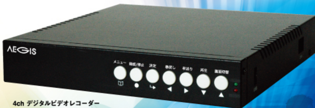
4ch デジタルビデオレコーダー 防犯レコーダー AC-250

ショップや駐車場など気になる場所や、小さいお子様やお年寄りの部屋を、ご自宅のテレビでチェックすることができます。 最大4つのカメラを接続して、同時に映し出すことができます。